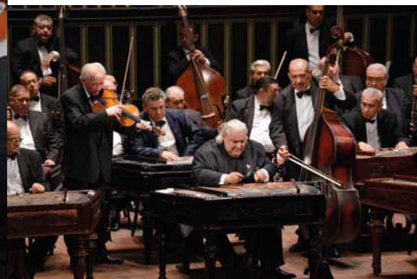
Erzsébetváros 2013. december 12.