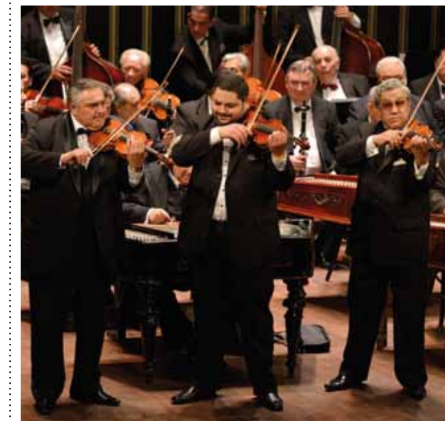
www.erzsebetvarosimedia.hu • www.erzsebetvaros.hu